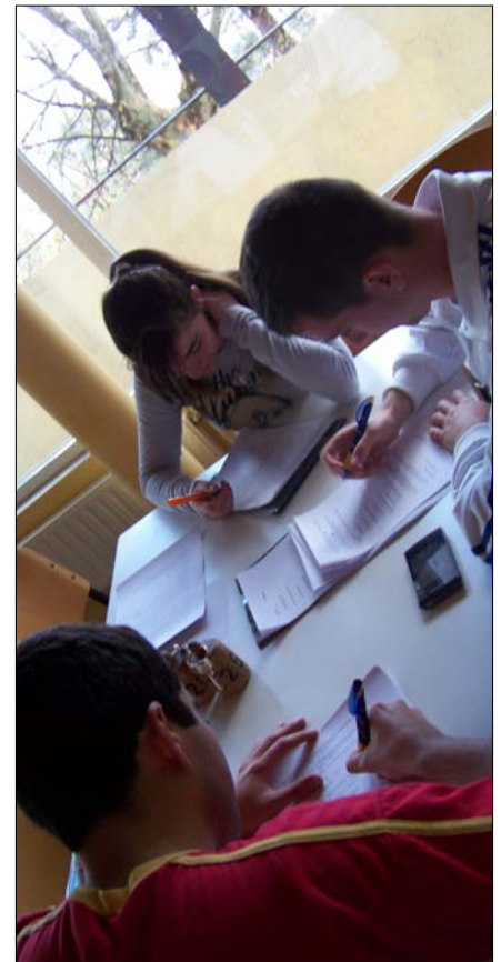
foto: Jóvenes ejercitando la inteligencia lingüística, la que más se trabaja junto con la lógico-matemática en el sistema educativo tradicional

Al centrarse este concepto en las capacidades ocultas de los trastornos neurológicos y del aprendizaje, no se pretende eludir el daño que causan, pero sí disolver algunos de los prejuicios que existen respecto a ellos. Además, terapéuticamente es