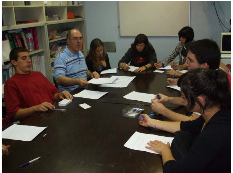
foto: Trabajando en grupo. Si no ejercitamos todas las inteligencias habrán adolescentes que se desmotivarán y perderán interés.

- Inteligencia intrapersonal , o la habilidad para conocer los aspectos internos de uno mismo: estar en contacto con la vida emocional propia, discriminar entre las distintas emociones y recurrir a ellas para reconocer y orientar la propia conducta,