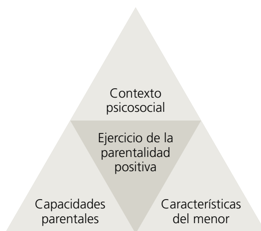
Figura 2: Dimensiones a evaluar en el programa.

Además de esta evaluación de la familia basada en el modelo de la parentalidad positiva, se pone especial énfasis en evaluar la calidad de la implementación del programa y de la marcha del mismo sesión a sesión. Con ese fin, se diseñan fichas de registro en las que se recogen todos esos aspectos, que son claves en un programa. Con todo ello esperamos que la realización del proceso de evaluación nos permita conocer la eficacia y la eficiencia del programa y tomar unas decisiones sobre unas bases lo más sólidas y seguras posibles.