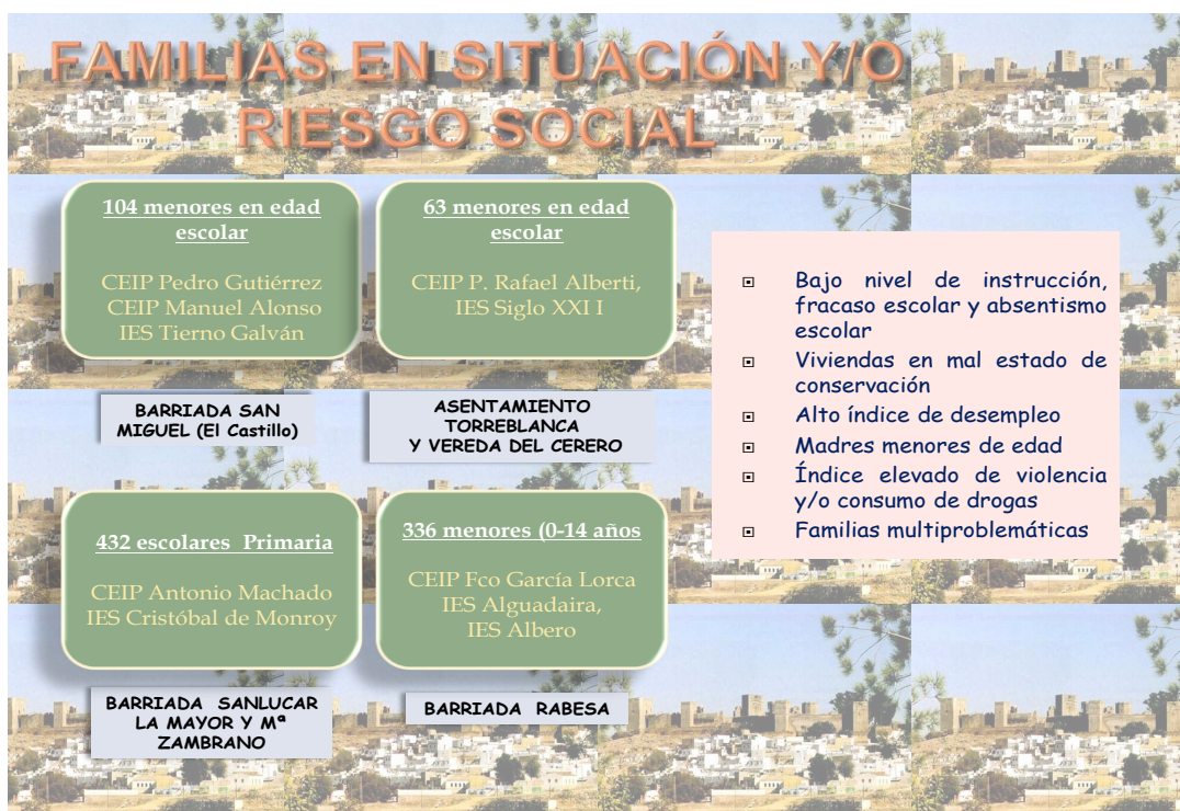
Tabla de elaboración propia

más específica, continuada, particular e integral en: la barriada “EL Castillo”, Barriada de Rabesa, Barriada Sanlucar la Mayor y M a Zambrano.