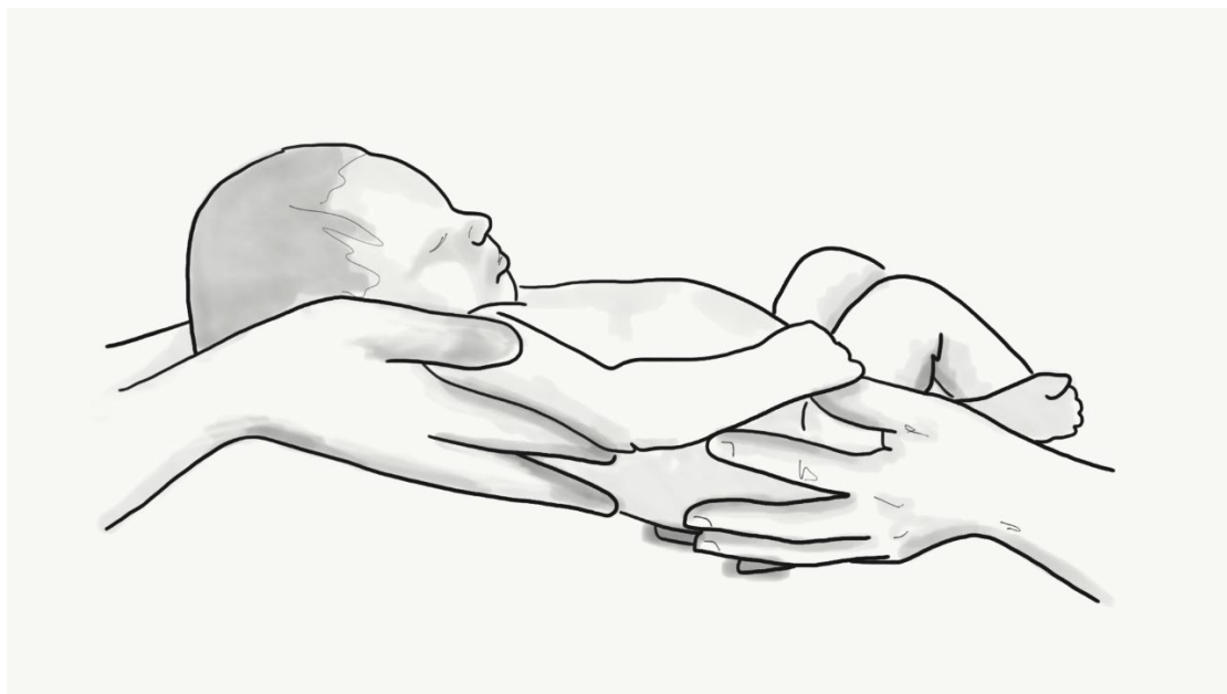
Ilustración 4. Crianza compartida

Juntos vamos a ayudar a tu hijo en su proceso de desarrollo para que alcance todos los retos que están por llegar: comunicar, jugar, comer solo, caminar, compartir con otros niños y seguir aprendiendo.