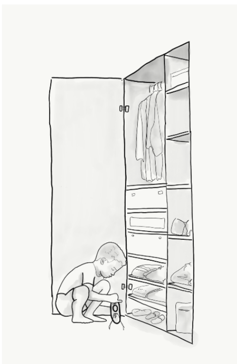
Ilustración 7. Decidir la ropa que voy a ponerme me da seguridad y favorece mi autoestima