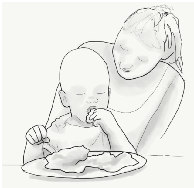
Ilustración 3. Cuando inician la alimentación de forma autónoma, a través de las manos reciben gran cantidad de estímulos sensoriales