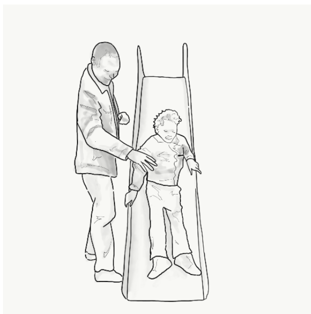
Ilustración 6. Jugar en el parque de forma autónoma me ayuda a ser libre