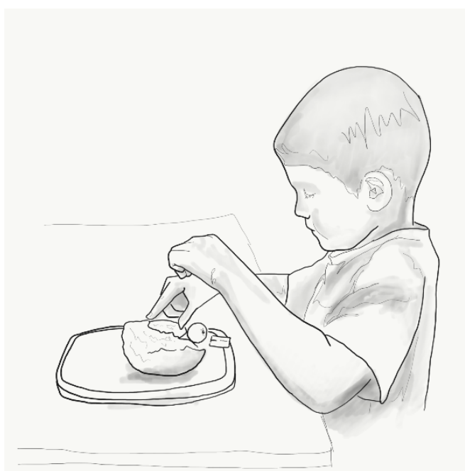
Ilustración 8. Cuando participo en preparar la comida, siento que es algo mío y me lo como más a gusto