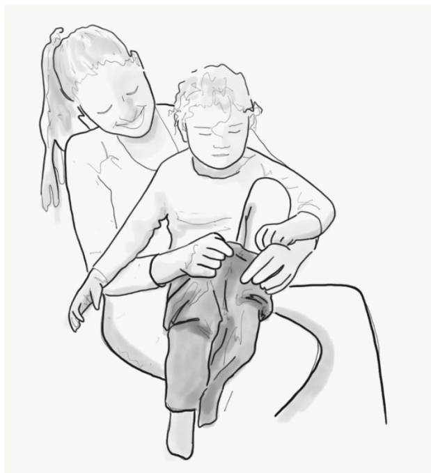
Ilustración 2. El bebé realiza los movimientos para facilitar el vestirse