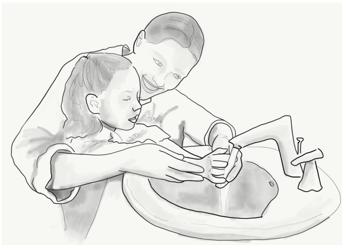
Ilustración 5. El aseo personal es un aspecto clave en el autocuidado