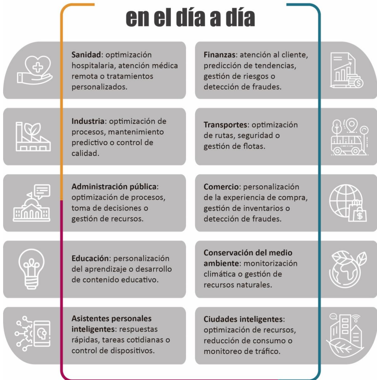
Ilustración 1. Ámbitos de la IA en el día a día (INTEF, 2024).