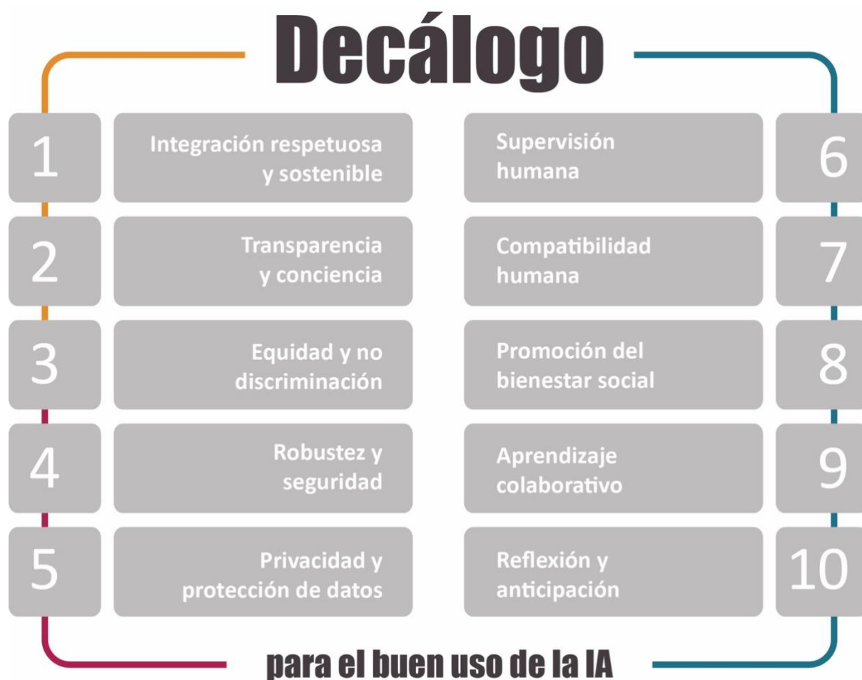
Ilustración 3. Decálogo para el buen uso de la IA (INTEF, 2024).

Estos valores, acciones y principios, ya recogidos en las recomendaciones y reglamentos existentes, como en la Recomendación sobre la ética de la inteligencia artificial de UNESCO 10 o en las Directrices éticas sobre el uso de inteligencia artificial (IA) y datos en la enseñanza y el aprendizaje para educadores de la Comisión Europea 11 , han de servir como guía para todos los agentes involucrados en este proceso: docentes, estudiantes, centros educativos, empresas tecnológicas y administraciones públicas.